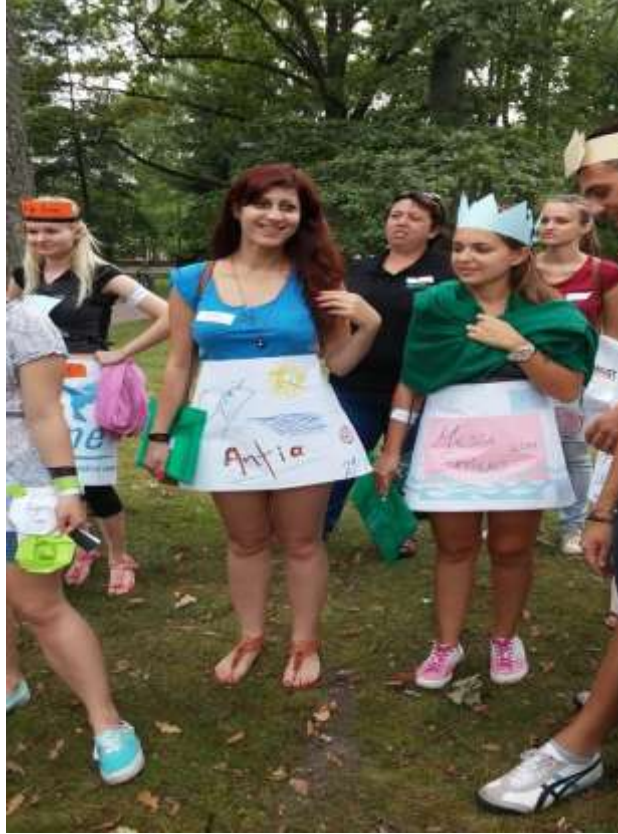
City Rally, Parnu şehrinde verilen 10 ayrı nokta arandı.