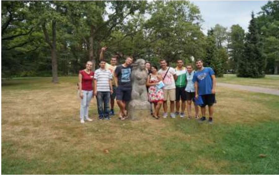
Interculturel evening 1, Gece Estonya, Letonya, Rusya, İsveç ülkelerinin tanıtımıyla yılbaşı temasında oldu.