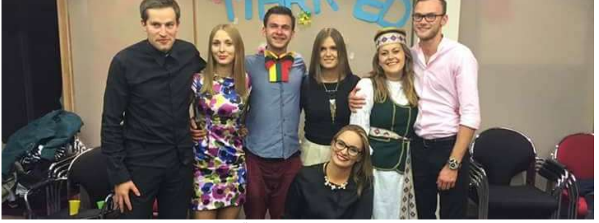
Ev sahipliğimizi yapan Litvanya Ekibi