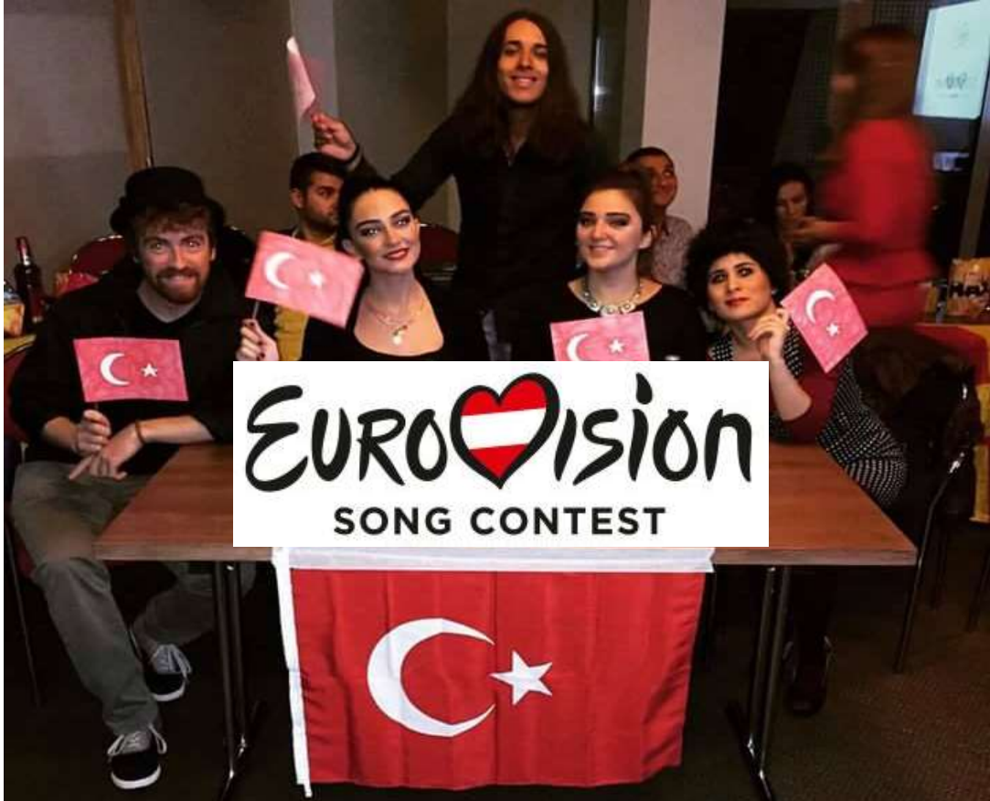
Türk Ekibi Eurovision için hazır!