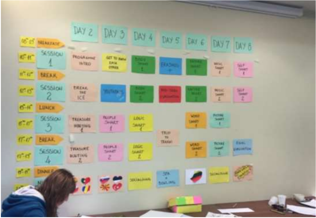
Frames of Mind 2- 8 Günlük Çalışma Programımız