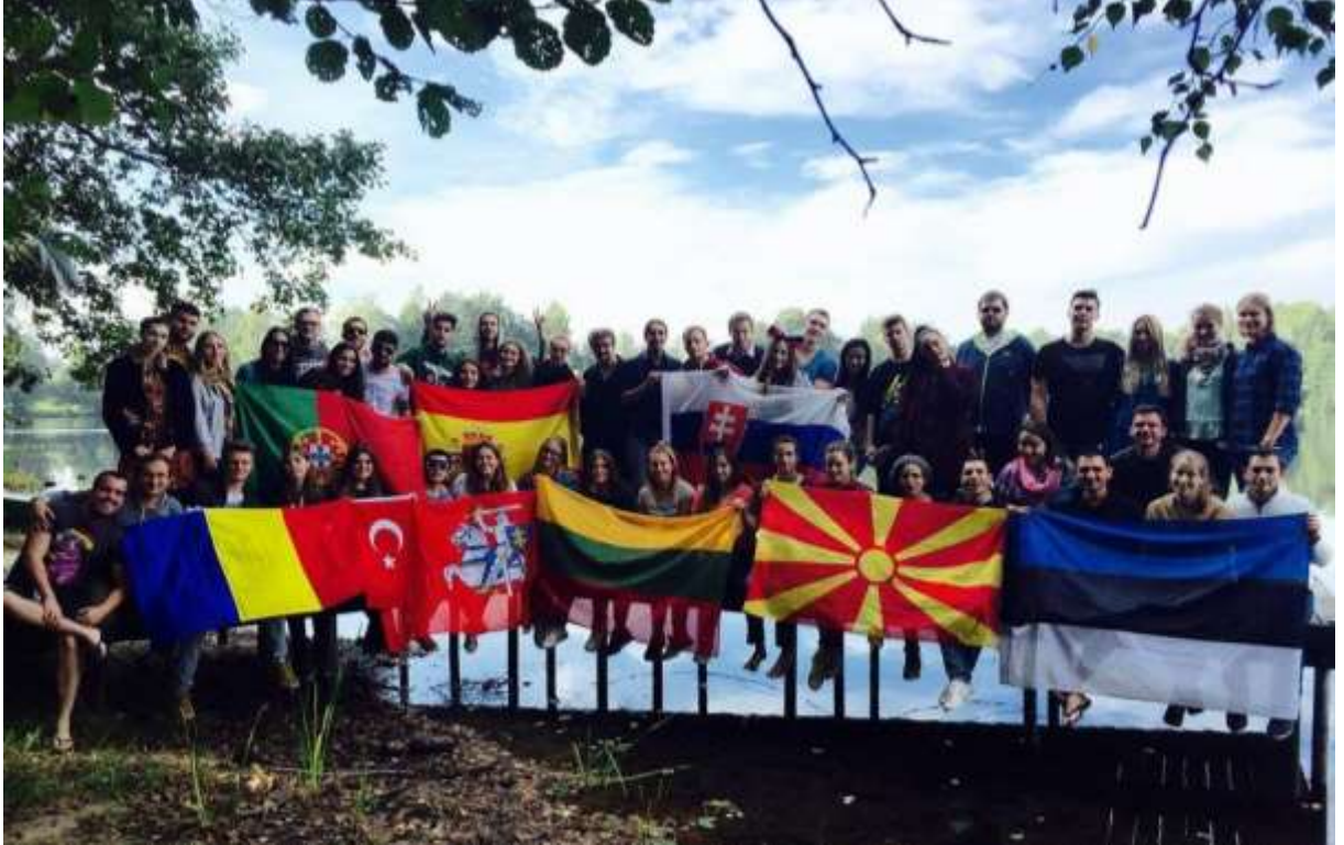
Frames of Mind 2 – Aile!