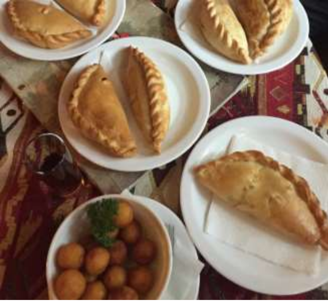
Kibling (Karaim Türklerinden Litvanya'ya miras)